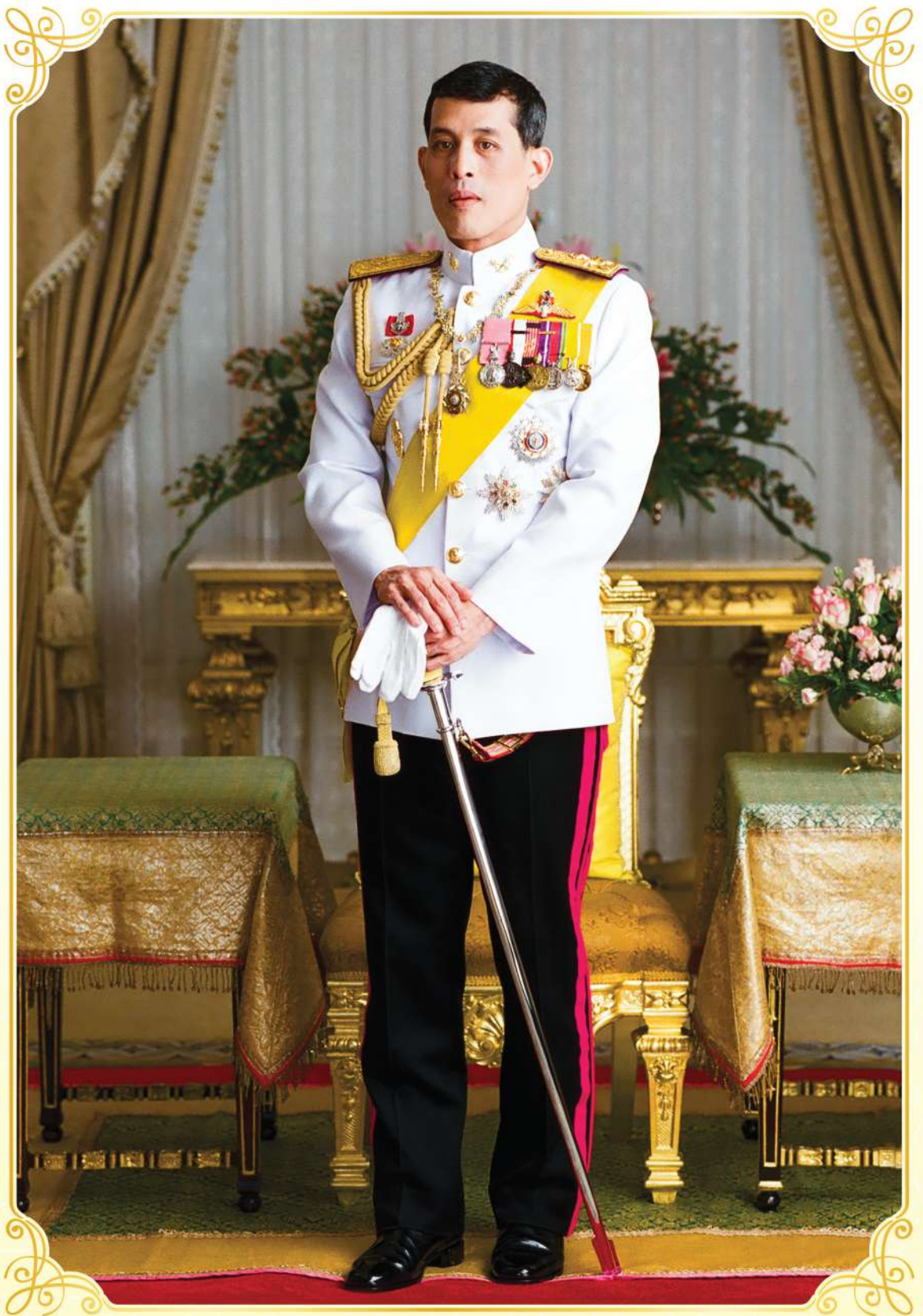
ภาพพระราชทาน