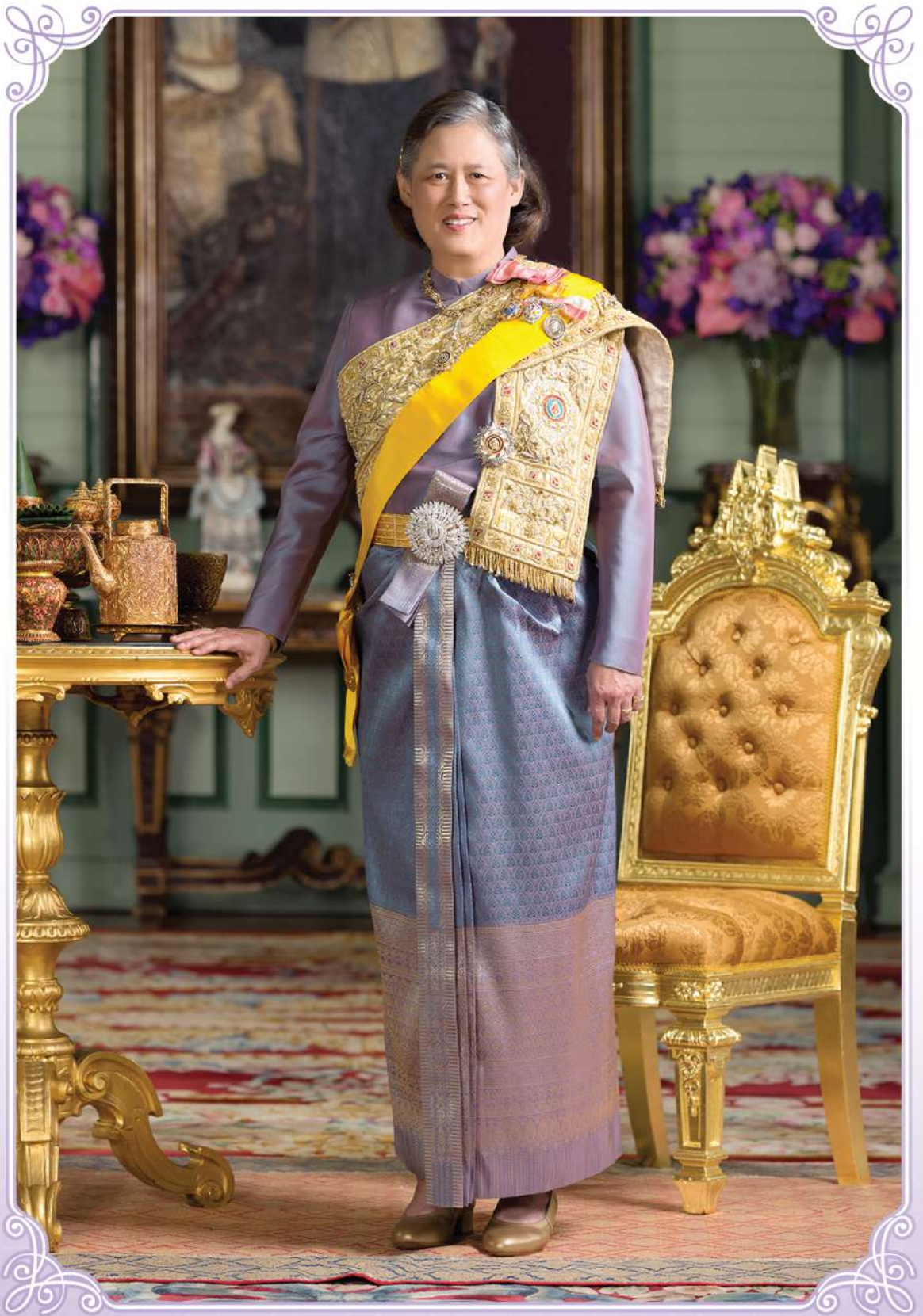
ภาพพระราชมารดา